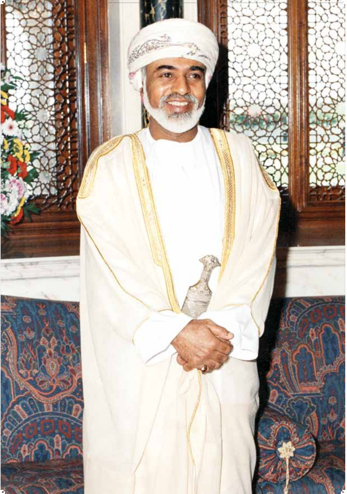
حضرة صاحب الجلالة السلطان قابوس بن سعيد المعظم - حفظه الله ورعاه